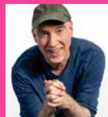
02.09. HG BUTZKO