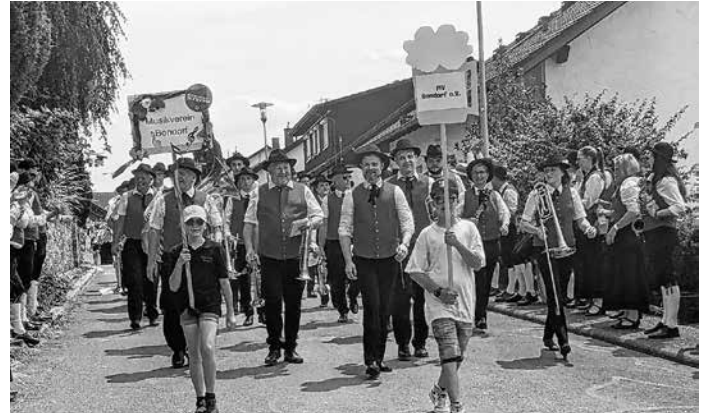
Umzug in Bierlingen

Anscheinend war der Festumzug etwas zu kurz – auf dem Weg zum Bus gab es für die Bierlinger Anwohner:innen noch ein wenig Marschmusik von den Bondorfer Musiker:innen.