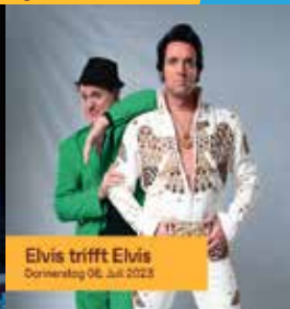
Elvis trifft Elvis Donnerstag 06. Juli 2023