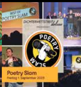
Poetry Slam Freitag 1. September 2023