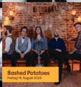
Bashed Potatoes Freitag 18. August 2023