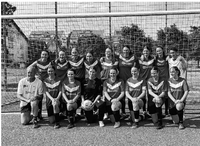
Jugendfußball

Es war insgesamt einfach eine tolle Mannschaftsleistung, die nächsten Aufstiegsspiele können also kommen, wir freuen uns schon darauf und hoffen auch auf eine genauso tolle Unterstützung unserer Fans wie heute auf dem Sportplatz.