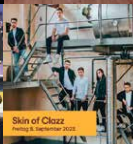
Skin ofClazz Freitag 8. September 2023

Ausführliche und aktualisierte Informationen sowie alle Neuigkeiten zu Sommer am See finden Sie hier: