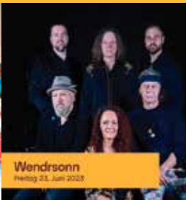
Wendrsson Freitag 23. Juni 2023