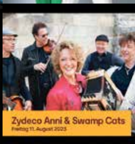
Zydeco Anni & Swamp Cats Freitag 11. August 2023