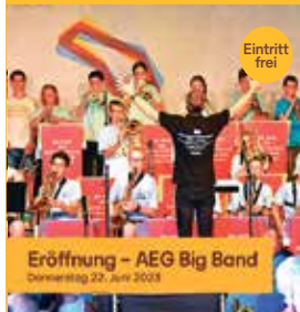
Eröffnung - AEG Big Band Donnerstag 22. Juni 2023

Stadt Böblingen Raum für Taten und Talente