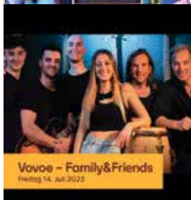
Vovoe - Family&Friends Freitag 14. Juli 2023