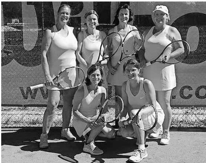
Die erfolgreichen Damen der Spielgemeinschaft NeckarGäu