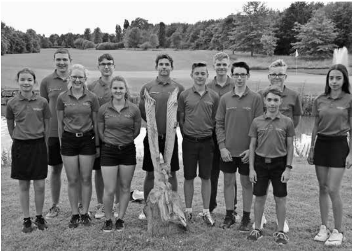
18 Loch Team