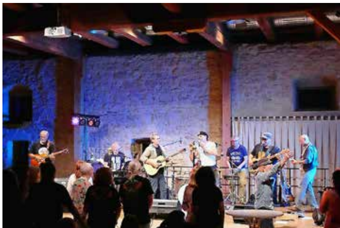
Der Abschluss-Song mit allen Künstlern auf der Bühne