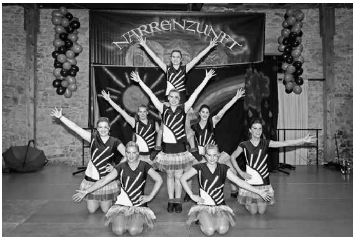
Showtanzgruppe Narrenzunft Bondorf mit dem neuen Motto „When the rain begins to fall“

Wir wollen uns bei allen Besuchern und Gästen, die bei unserem Fasnets- Warm-Up am 5. Januar 2018 dabei waren, für den tollen Abend in der Zehntscheuer bedanken. Ein besonderer Dank geht an alle Gruppen, die mit ihren Auftritten zu unserem Programm beigetragen haben. Des Weiteren haben wir uns sehr über die zahlreichen Gäste bei unserem diesjährigen Maskenabstauben am 6. Januar 2018 vor dem Feuerwehrhaus gefreut. Mit der Taufe der sechs Bernlochhexen und einem Bondorfer Waidag können wir nun in die Fasnetsaison 2018 starten.