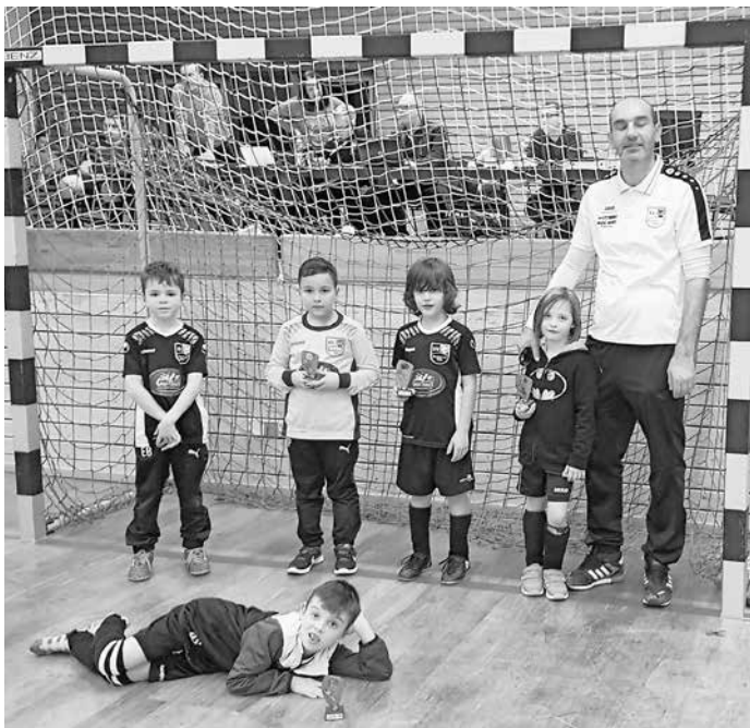
Unsere Jungs zeigen ihren Pokal nach dem Turnier

Torschützen für Bondorf 2: Arad (3 Tore), Janik (1 Tor). Vielen Dank an alle Eltern, die geholfen haben!!!