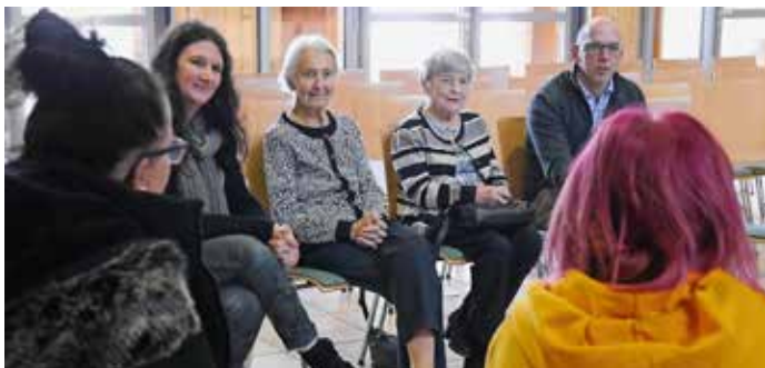
Workshop „Voll krass-Alter“