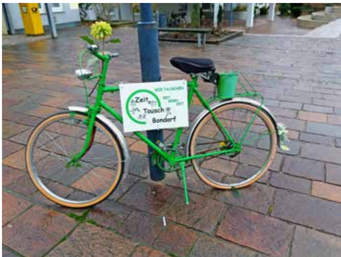
Unser Fahrrad hat einen neuen Standort gefunden