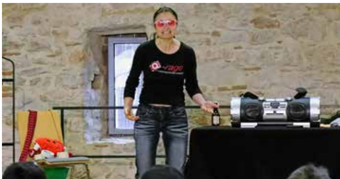
Die Rosarote Brille

Weitere Bilder gibt es auf Facebook: JuHaBondorf.