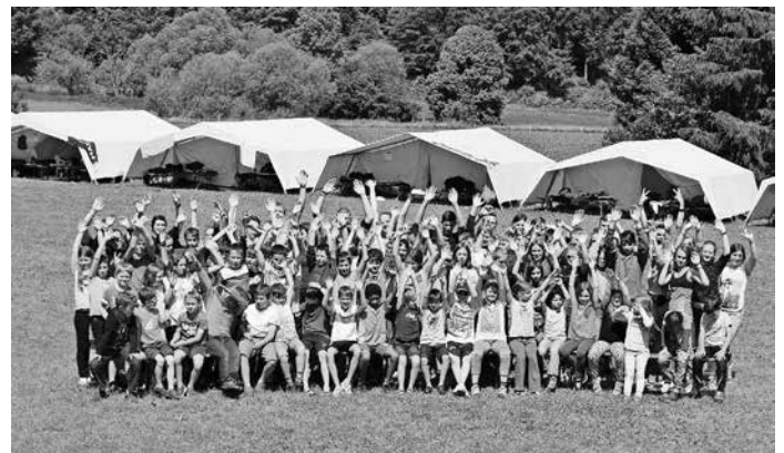
Ein Haufen voller Spaß:-)

Die meiste Zeit waren wir mit einem blauen Himmel und warmen Temperaturen gesegnet, obwohl so schlechtes Wetter vorhergesagt war. Gebete wurden erhört und das gesamte Programm konnte wie geplant umgesetzt werden. So wurden dienstags Fungruppen angeboten, wobei sich die Kinder in Tanz-, Bastel- und Entspannungsworkshops ausprobierten. Das Highlight war hierbei für einige das handwerkliche Floßbauen, da diese später auch in die Donau gesetzt wurden und die Kinder selbst darauf fahren durften. Der Tag wurde mit einem spannenden und kreativen bunten Abend abgeschlossen, anschließend fielen sowohl Kinder als auch Mitarbeiter müde ins Bett. Weitere Geschichten Davids und ein Dorfspiel standen am nächsten Tag auf dem Plan. Der „Freundschaftsbund“, welcher abends geplant war, musste leider vorzeitig wegen einem aufkommendem Gewittersturm abgebrochen werden.