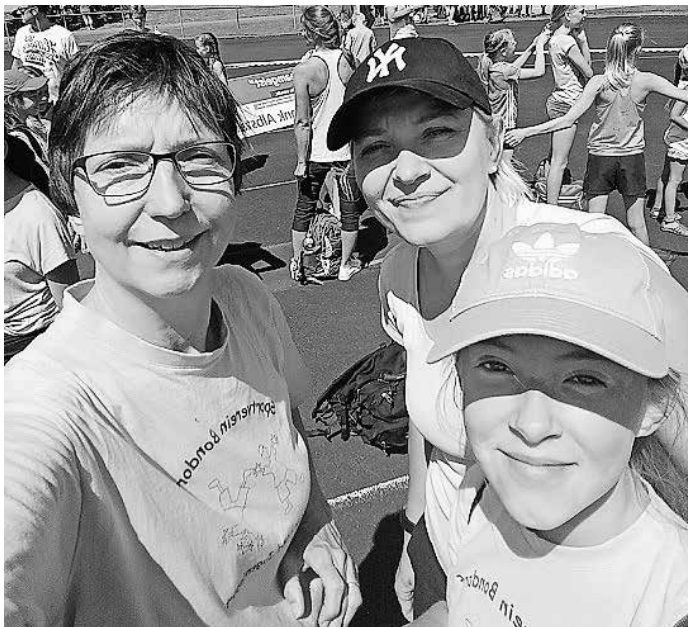
Bild: Kinder- und Jugendsport