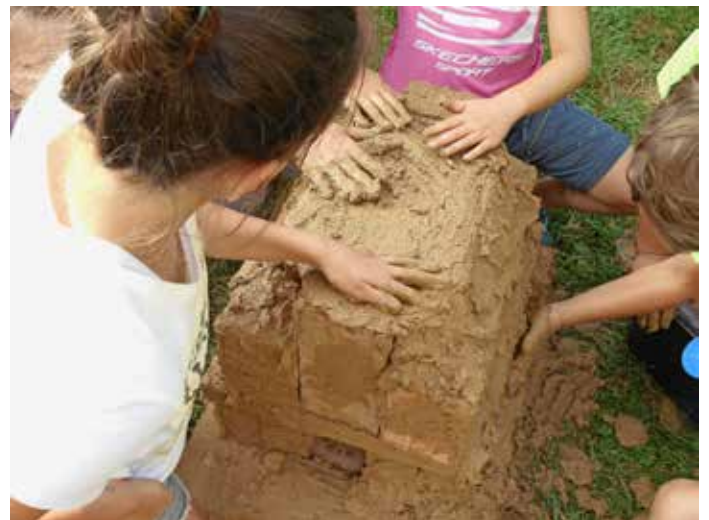
Bau eines Lehmofens

Am Mittwoch durfte sich jedes Kind einen von drei möglichen Workshops aussuchen. Auf dem Programm standen afrikanisches Trommeln, mit Pfeil und Bogen schießen und der Bau eines Lehmofens zum Brotbacken.