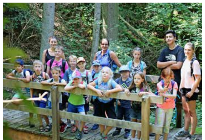
Abenteuer in der Wolfsschlucht

Am Donnerstag stand ein Ausflug nach Bad Niedernau an. Gänzlich harmlos fing der Tag mit der Busfahrt nach Rottenburg an. Doch kaum angekommen waren die Kinder und ihre 11 Betreuer schon mitten drin in ihrem ersten Dschungelabenteuer: Der Gang durch die Wolfsschlucht. Jedes Kind durfte seinen Mut beweisen und alleine die ca. 400 Meter durch die Wolfsschlucht gehen. Etwas mulmig wurde es einigen spätestens dann, als das erste Wolfsheulen zu hören war. Am Ende jedoch stimmten alle in das menschliche Wolfsgeheul ein und die Angst war vergessen.