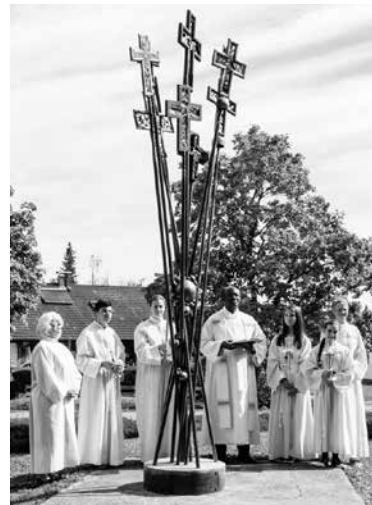
Kreuze – Röhrig

Vergangenen Sonntag feier- ten wir im Rahmen des Gäu- gottesdienstes den Weihe- tag unserer Kirche. Es war ein festlicher Gottesdienst, der von einer kleinen Grup- pe vorbereitet und von Pfar- rer Uche geleitet wurde.