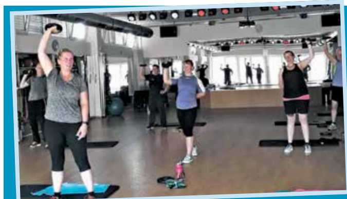
Alle schwitzen, sind aber gut drauf, denn die Schinderei zeigt nach der Zwischenmessung zur Halbzeit kilowise Erfolge.

Nach der Renovierung und Modernisierung lädt das Gym-24 (Gültstein, Ohmstraße 3) am Sonntag von 11 bis 17 Uhr alle Mitglieder und Interessierten zum Re-Opening mit einer Erlebnismesse ein.