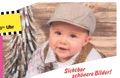
Sichtbar schönere Bilder!

KREISZEITUNG foto-markt SCHULSTRASSE 9 • 71083 HERRENBERG