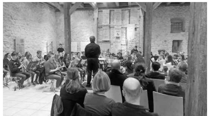
D2/D3-Teilnehmer mit dem Kreisjugendorchester