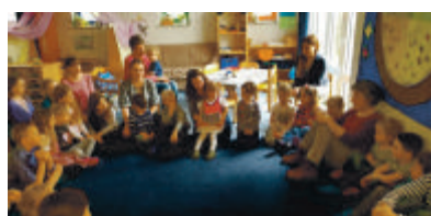
Reise nach Österreich