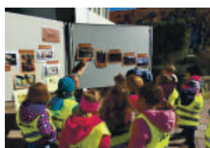
Reise der Schokolade