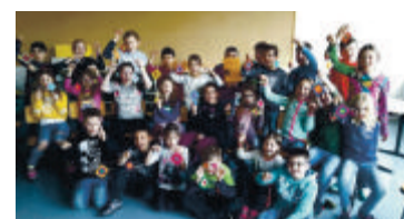
„Ojo de Dios“