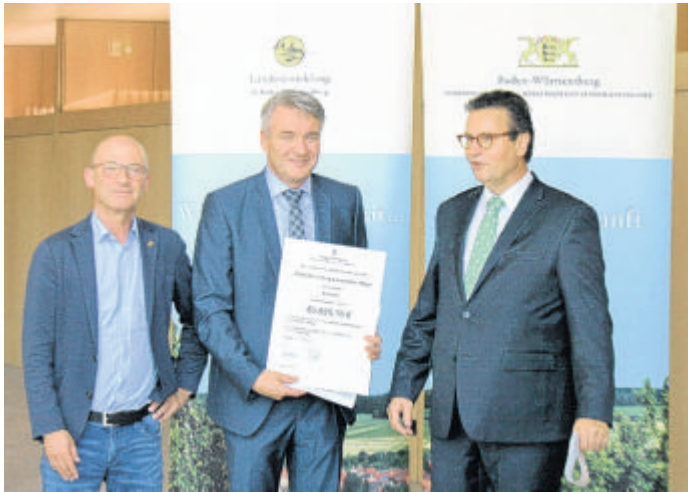
v.l.: Dr. Bernd Murschel (MdL), Bürgermeister Bernd Dürr, Minister Peter Hauk (MdL) bei der Übergabe des Förderbescheids im Landtag.

einen weiteren Förderbescheid zu übergeben“, betonte der Minister. Denn die modernisierten Wege dienen nicht nur der Landwirtschaft. Vielmehr profitieren alle Einwohner von der multifunktionalen Eigenschaft der Wege, da diese auch bestens als Rad-, Wanderoder Spazierwege genutzt werden können. Seit Bestehen des Förderprogramms wurden landesweit bereits über 60 Kilometer ländliche Wege grundlegend modernisiert. Bondorf erhält 63.025,70 Euro für den Feldwegebau im Jahr 2019.