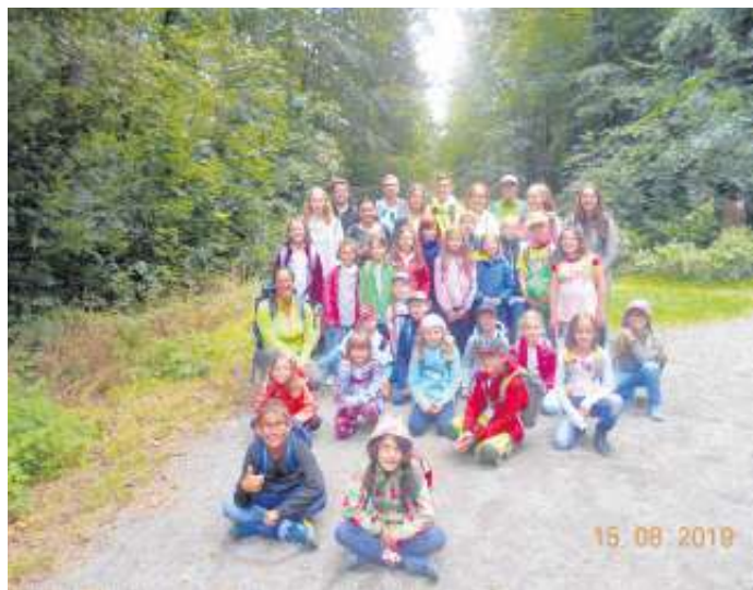
Ausflug zum Haus des Waldes