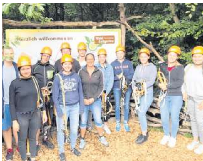
Im Hochseilgarten Herrenberg

Als Dank für den Einsatz und das Engagement gibt es jedes Jahr einen Ausflug für die pädagogischen Helfer der Ferienbetreuung. Dieses Jahr waren wir zusammen im Hochseilgarten in Herrenberg. Dort hatten wir eine Menge Spaß zusammen und manch einer hat seine eigenen Grenzen bzw. Ängste bezwungen.