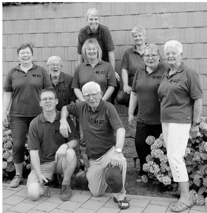
Die Spielerinnen und Spieler des Harmonika Clubs Ergänzigen