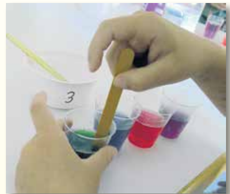
Experiment mit Alltagsmaterialien

Am Dienstag, den 3. September 2019, trafen sich zehn neugierige Bondorfer Kinder zu einem Experimentiernachmittag im Bürgersaal des Rathauses. Nachdem uns anfangs die durch Reibung elektrisch aufgeladenen Luftballons die Haare zu Berge stehen ließen und wir sie sogar an die Wand kleben konnten, fanden wir danach heraus, dass ein schwarzer Filzstift durchaus auch bunt sein kann und es entstanden farbenfrohe Kunstwerke aus Filterpapier. Später experimentierten wir noch mit Rotkohlsaft und entdeckten erstaunliche Farbveränderungen nach der Zugabe von Essig oder auch Waschmittel. Die Kinder waren mit Pipette und Gläschen eifrig am Werk und nahmen sicherlich auch einige Ideen mit nach Hause.