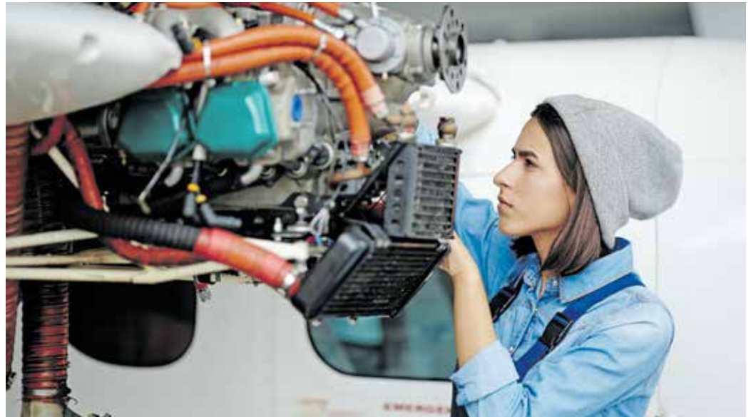
Die Sorge um die Rente kann durch die betriebliche Altersvorsorge gemildert werden.

Weihnachtsgeld in die Rente investieren: Soll das monatliche Einkommen nicht geschmälert werden, können Arbeitnehmer ihre Beiträge auch aus Sonderzahlungen wie dem Weihnachtsgeld oder aus Gehaltserhöhungen finanzieren. So bleibt Ihr Nettolohn gleich, obwohl bei Steuern und Sozialversicherungen gespart und für das Alter vorgesorgt wird. Infos: www.nuernberger.de (djd)