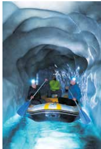
Mit dem Paddel die Gletscherwelt erkunden: Auch das ist eine originelle Geschenkidee für Abenteuerlustige.