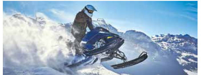
Adrenalin tanken und pure Action erleben: Aufregende Geschenkideen sorgen für Abwechslung.

in die Schönheit der bisher unbekanntesten Eisswelt eintauchen. (djd)