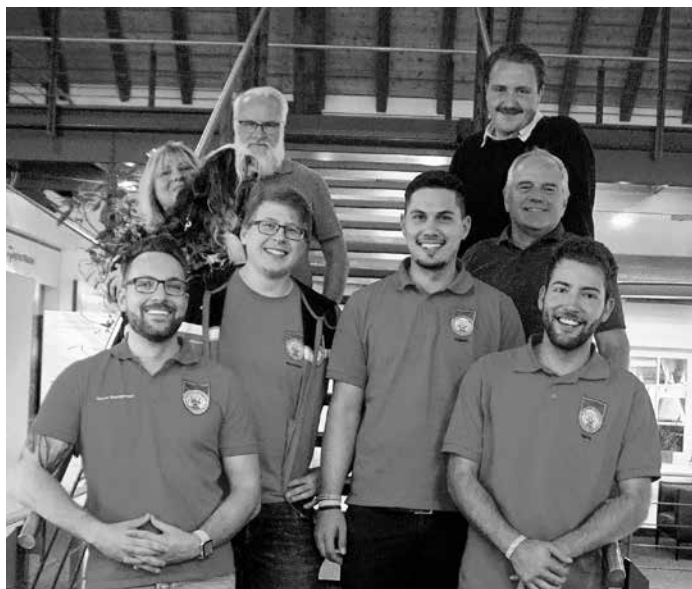
Teilnehmer der Dorfmeisterschaft

Am 29. September 2019 haben wie bereits im Vorjahr zwei Mannschaften des Schützenvereins an den Bondorfer Golf-Dorfmeisterschaften teilgenommen.