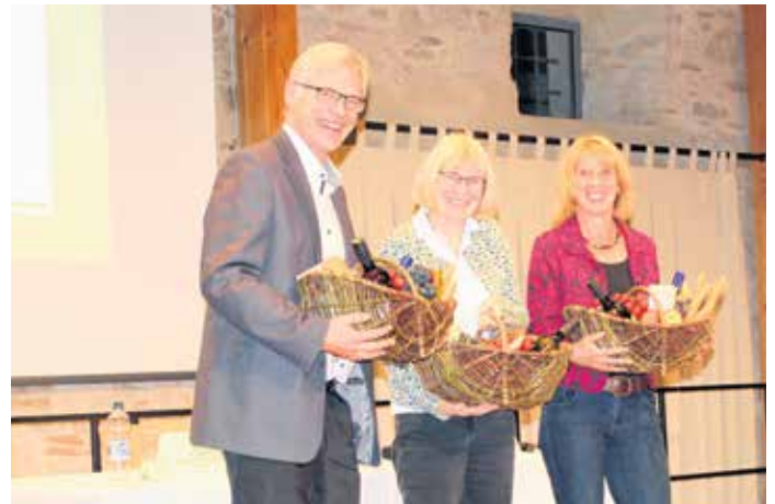
Ein herzliches Dankeschön an die Referenten

In der abschließenden Fragerunde wurden zahlreiche Fragen aus dem Publikum durch die Fachleute beantwortet. Am Ende der Veranstaltung nutzten die Gäste noch die Möglichkeit, sich an den Informationstischen zu informieren.