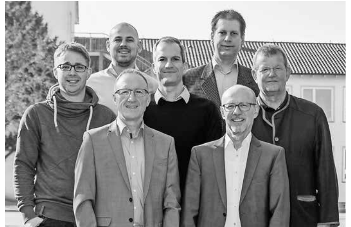
FDP-Kandidaten des Wahlkreises 4 „Oberes Gäu“ zum Kreistag

Mitglieder des Ortsverbandes und Kandidaten zum Gemeinderat und zum Kreistag des FDP Ortsverbandes Herrenberg und Gäu werden den Bürgerinnen und Bürgern Gelegenheit geben, sich über die politischen Ziele in der Gemeinde Herrenberg im Kreis Böblingen auszutauschen.