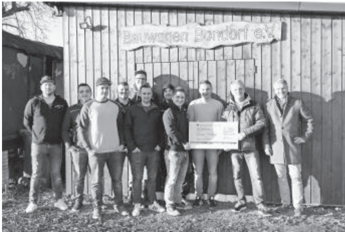
Scheckübergabe des Bauwagen Bondorfe.V. an den Mukoviszidose e.V.

Sonnenstudio gegenüber vom Rathaus. Wir freuen uns über viele Besucher und einen schönen Umzug in Bondorf.