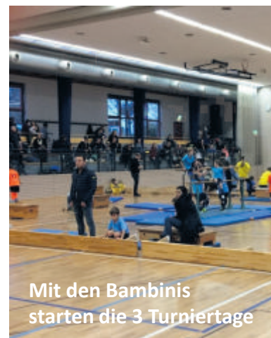
Mit den Bambini starten die 3 Turniertage

Fr. und Sa. mit Rahmenprogramm unseres Partners REWE.