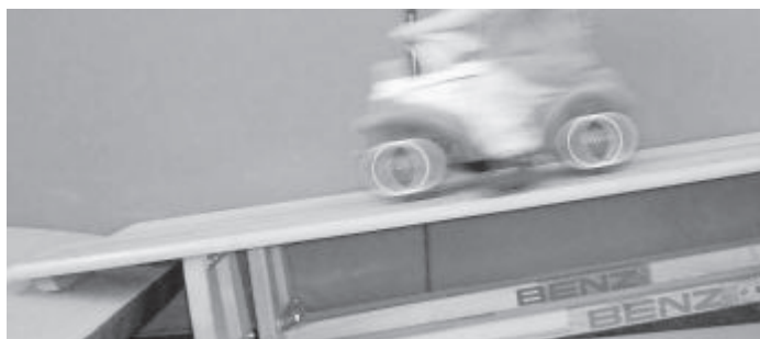
Bild: Kinder- und Jugendsport

Am Montag, 7. Januar 2019 flitzen wir mit dem Bobby Car durch die Turnhalle. Wer möchte, darf sein eigenes Fahrzeug (mit sauberen Reifen) mitbringen.