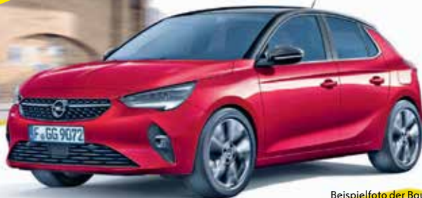
Beispielfoto der Baureihe. Ausstattungsmerkmale ggf. nicht Bestandteil des Angebots.