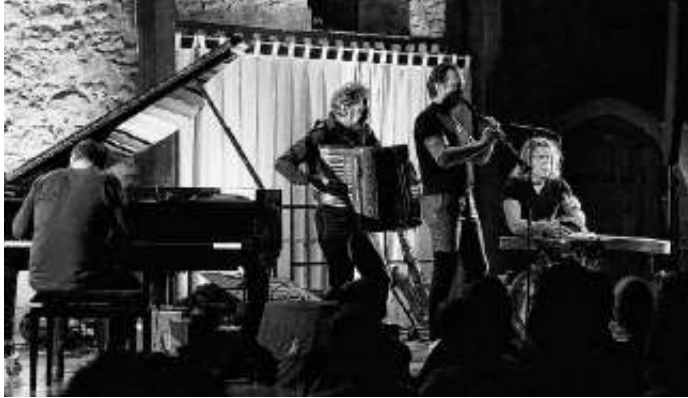
Quadro Nuevo im Kornsaal

Das neue FKK-Team freut sich auf Sie und heißt Sie schon jetzt sehr herzlich willkommen!