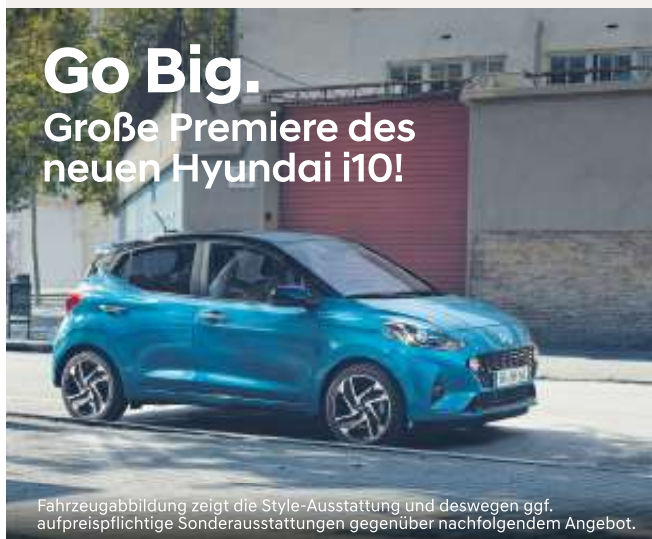
Fahrzeugabbildung zeigt die Style-Ausstattung und deswegen ggf. aufpreispflichtige Sonderausstattungen gegenüber nachfolgendem Angebot.

Autohaus Meiling hat schon vor der offiziellen Premiere den neuen Hyundai i10