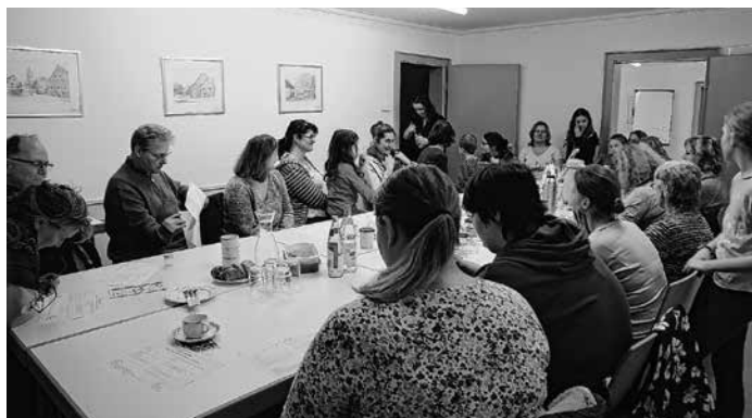
Do it yourself

re Nicht-Mitglieder aus Neugierde zu dem Thema und für den ZeitTausch angemeldet haben. Gemeinsam bereiteten wir einen Lippenbalsam und einen Geschirreiniger für die Spülmaschine zu. Die Düfte für das Lippenbalsam schmeichelten uns an der Nase. Während der Zubereitung nutzten wir die gemeinsame Zeit, plauderten und tauschten Tipps und Tricks für einen umweltbewussten Alltag aus. Es ist erstaunlich, wie viele Anbieter allein Bondorf dafür sorgen, dass wir saisonal und regional unsere Lebensmittel bequem einkaufen können. Passend zum Thema wurden wir mit Gemüsesticks aus Bondorf und leckeren Dips und Brotaufstrichen verwöhnt. Die Kinder nutzten die schulfreie Zeit und spielten gemeinsam im Nebenraum und auf dem Hof.