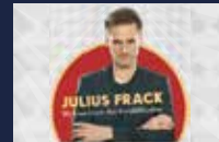
SA. 13.06.2020 | 15 Uhr Kinder- und Familienshow „Ich kann zaubern“