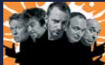
SO. 31.05.2020 Fünf

Fünf machen gesungene Musicomedy deutschlandweit populär und werden nicht müde. Sie haben die Lizenz zum Blödeln in gereimter Mission.