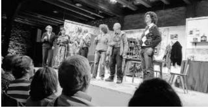
Aufführung 2019 „Weihnachtstriebe“