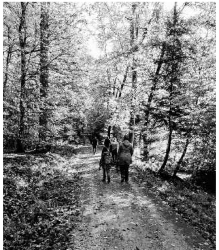
Herbstwanderung im Schönbuch, Oktober 2020

Bei schönstem Herbstwetter am Samstag machte sich der ZeitTausch mit einigen Mitgliedern und Interessierten auf zu einer gemütlichen Rundwanderung durch den Schönbuch. Mit netten Begegnungen und Gesprächen in der wundervollen Natur konnten alle das Wochenende genießen.