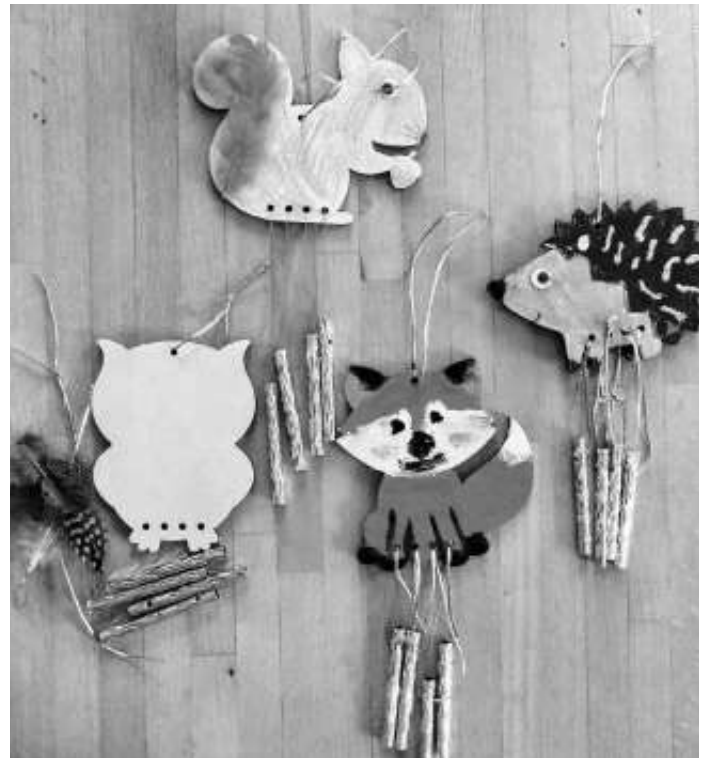
Bastelarbeiten der Kinderbibeltage