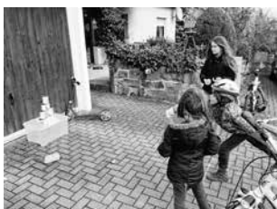
Bild: Familienzentrum geboden haben oder Wolle gespendet haben zur Verschönerung des Zauns!

Wir hatten eine abwechslungsreiche Woche mit 18 Stationen plus Ostereier und -hasensuche! Sowohl an Aufgaben und Herausforderungen als auch wettermäßig war alles dabei – zum Beispiel Dosenwerfen bei gefühlten Minusgraden Mitte der Woche. Vielen Dank an alle, die eine Station angeboten haben oder Wolle gespendet haben zur Verschönerung