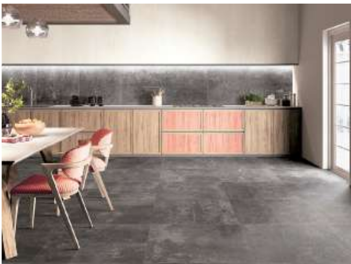
Wenn Koch-, Ess- und Wohnbereich verschmelzen, ist ein Fliesenboden ideal, um die Räume auch optisch und funktional zu verbinden.