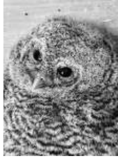
Waldkauz im Eulenkasten