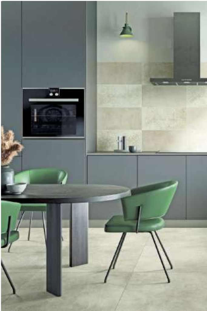
Die ästhetischen und funktionalen Vorzüge keramischer Fliesen bewähren sich in Küche und Esszimmer sowohl an der Wand als auch am Boden.