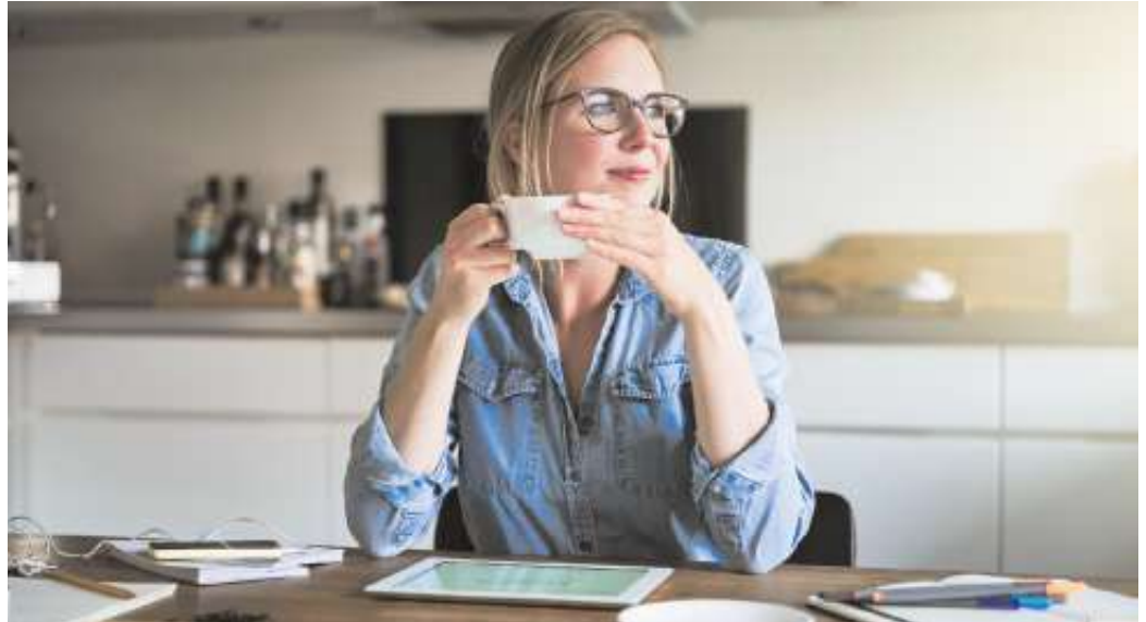
Wer mutig und flexibel ist, kann die Krise als Chance begreifen und sie zum Anlass nehmen, sich beruflich noch einmal völlig neu zu orientieren.

Die wirtschaftlichen Auswirkungen der Corona-Pandemie sind sehr unterschiedlich. Manche Branchen hat es mit voller Wucht erwischt. Wer mutig und flexibel ist, kann die Krise zum Anlass nehmen, sich beruflich neu zu orientieren. Manche Arbeitnehmerinnen und Arbeitnehmer haben auch erst während der Pandemie gemerkt, wie unzufrieden sie mit ihrer bisherigen Tätigkeit sind. Egal aus welchem Grund man die Reset-Taste drücken will: Wer als Quereinsteiger in einen anderen Beruf wechseln möchte, sollte genau prüfen, welche Perspektiven das angepeilte Berufsumfeld bietet. Eine Nische unter den Berufen im boomenden Gesundheitswesen ist die noch junge Tätigkeit als Vitametiker oder als Vitametikerin.