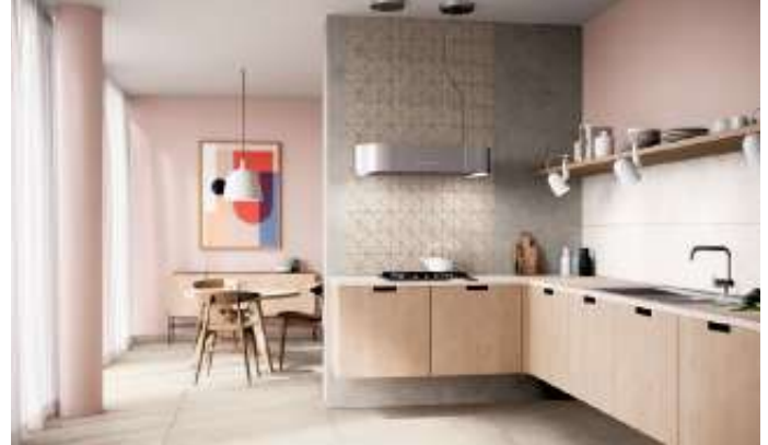
Bei modernen Einrichtungskonzepten verschmelzen Koch- und Wohnbereich häufig. Eine durchgängige Bodengestaltung mit XL-Fliesen schafft dabei optische Weite.

Langfristig wirtschaftlich: ein zeitlos hochwertiger, robuster Küchenboden Egal für welche Fliesenformate und -designs man sich entscheidet, die praktischen Vorzüge in der Küche bietet jede keramische Oberfläche. Denn Fliesen gelten nicht umsonst als langlebige und pflegeleichte Beläge, die