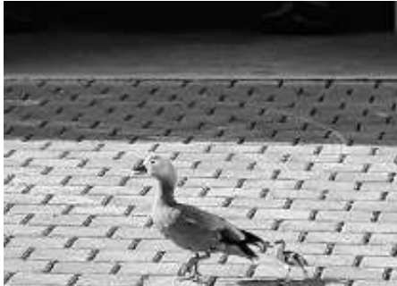
Rostgans mit einem Jungtier

Jetzt wo der Frühling langsam sein Gesicht zeigt, ist es schön anzusehen, dass sich so viele Vögel bei uns in der Gemeinde wohlfühlen. Das Engagement für den Vogel- und Naturschutz der Gemeinde und Vereine trägt Früchte. Aber auch den Privatpersonen, die aus eigenem Antrieb Nist- und Brutplätze schaffen sei hier gedankt. Das Schuppegebiet beim Schützenhaus ist ein schönes Beispiel. Dort wurde ein toller Lebensraum geschaffen. Wer sich die Zeit nimmt, kann dort Rostgänse, Turmfalken, Bachstelzen, Rauschschwalben u.v.m. sehen. Von einer guten Vogelpopulation kann auf eine intakte Fauna geschlossen werden.