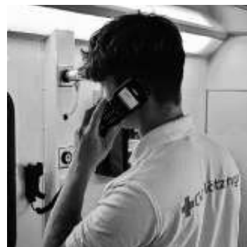
Digitalfunk im Einsatz

In den nächsten Tagen verteilen unsere Helferinnen und Helfer in den Gemeinden Jettingen, Bondorf, Öschelbronn und Mötzingen Flyer unserer Spendensammelwoche.