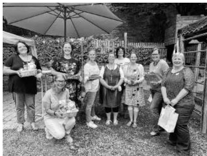
Das (erweiterte) Vorstandsteam mit Gründungsfrauen

Die Geschenkkörbe für unsere bis heute aktiven Gründungsfrauen sowie unsere neueste Mitgliedsfamilie wurden gespendet vom Hof Hiller. Für unsere Schnurkombola haben folgende Unternehmen Preise gespendet: dm Drogeriemarkt, Kreissparkasse, Oasis Teehandel, Spielkiste, Volksbank. Dafür sagen wir auch an dieser Stelle ganz herzlichen Dank!