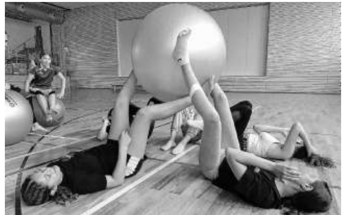
Turnerinnen beim Beginn des Trainings

derturnfest. Durch regelmäßige Teilnahme an den Turnstunden und Freude am intensiven Training können dann die geforderten Übungen bei den Wettkämpfen gezeigt werden.