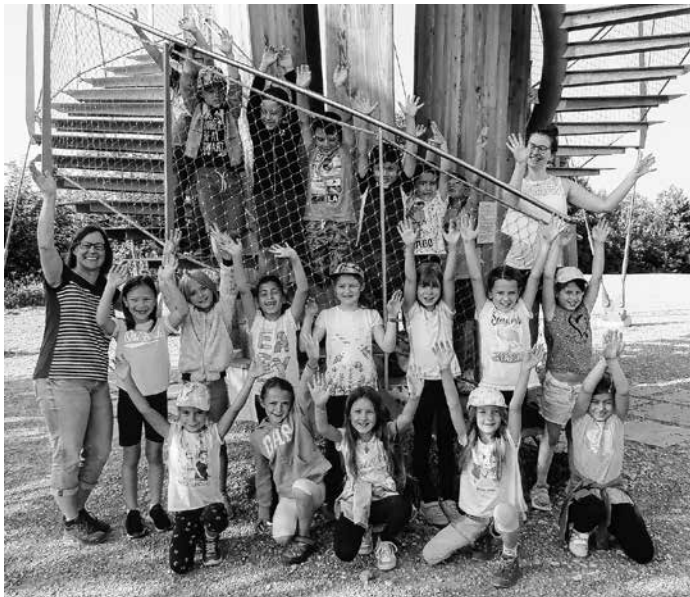
Klasse 1c – Ausflug zum Schönbuchturm Thema der Projektstage: Türme