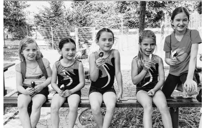
Bilder: Gabi Rehorsch

Besonders auf dem Schwebebalken konnte die tolle Körperspannung der jungen Nachwuchsturnerinnen bewundert werden. Übungsleiterin Gabi freut sich sehr über die Fortschritte der Mädchen. Außerdem präsentierten die Turnerinnen Ihren Eltern Ausschnitte aus den wettkampfvorbereitenden Übungen – da für 2022 die Teilnahme am Kindercup-Gerätturnen geplant ist. Nach Ende der Vorführung freuten sich die Mädchen sehr über die „ferieneinläutende Eisüberraschung“ auf dem schönen Vorplatz bei den Umkleiden.