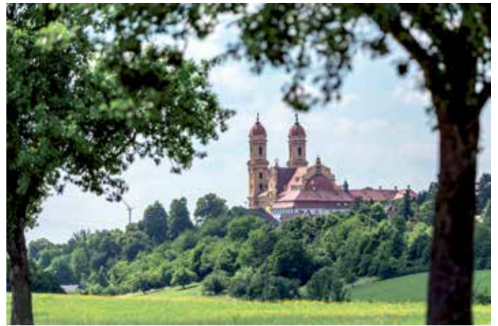
Der Kapellenweg startet an der prächtigen barocken Wallfahrtskirche Schönenberg.

Lust und Laune können Urlauber unter den verschiedenen Tourenvorschlägen, die es unter www.ellwangen.de zu finden gibt, die passende Route auswählen. Als Auftakt des Wandervergnügens bietet sich einer der zwölf einfachen Rundwanderwege des Wanderwegenetzes Ellwanger-Rindelbach-Schrezheim an. Zum Beispiel der Kapellenweg, auf dem sich Natur- und Kulturlebnisse miteinander verbinden lassen. Von der prächtigen barocken Wallfahrtskirche Schönenberg führt die 12 Kilometer lange Tour Wanderer durch die sanfte Hügellandschaft der Ellwanger Berge. Die Wallfahrtskirche mit ihren kostbaren Stuck-