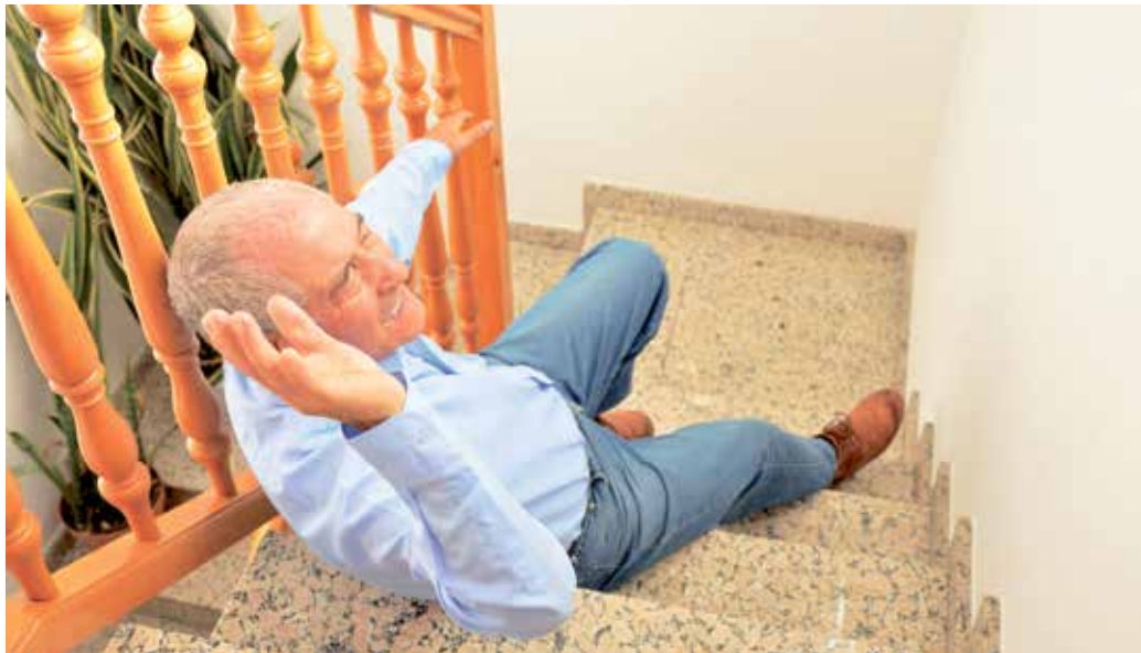
Ein Fehltritt im eigenen Haushalt kann schmerzhaft Folgen nach sich ziehen. Mit einfachen Mitteln lassen sich Oberflächen rutschfest machen.

sich ziehen. Das Statistische Bundesamt spricht von bis zu 2,8 Millionen Unfällen in den eigenen vier Wänden pro Jahr, Menschen über 65 sind besonders oft betroffen. Dabei können schon einfache Maßnahmen die Risiken minimieren.