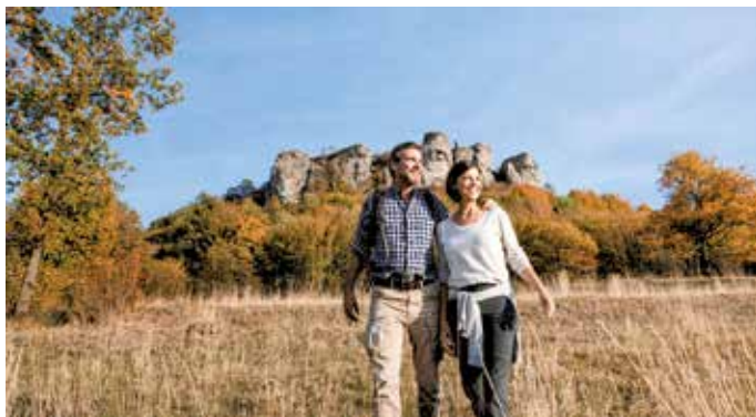
Die Landschaften rund um Bad Staffelstein sind spektakulär und verlocken zu ausgiebigen Entdeckungstouren.

zahlreiche Genussanbieter ihre selbst produzierten Spezialitäten in eigenen kleinen Läden auf dem Hof – ob duftendes Holzofenbrot, süße Marmeladen und pikante Chutneys, hochprozentigen Schnaps, Wurst oder Fisch. Wer möchte, kann Brennerien und Mühlen besichtigen oder einen Bio-Bauernhof besuchen und dabei mehr über die einzelnen Betriebe und deren Handwerk erfahren. Viel Spaß verspricht beispielsweise auch das Mitbackerlebnis in einer Traditionsbäckerei bei dem man sich an das Herstellen der typisch fränkischen ausgezogenen Krapfen wagen kann. Oder wie wäre es mit einer geführten Genusswanderung durch die Traumlandschaft?