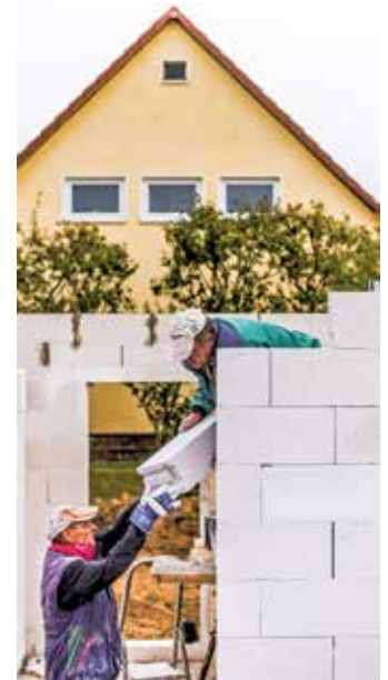
Wenn die Klimaschutzziele 2030 erreicht werden sollen, müssen Bauherren und Eigenheimbesitzer bei der Umsetzung hoher energetischer Anforderungen finanziell unterstützt werden.

Modernisierungsförderung soll sich an den CO2-Einsparungen orientieren