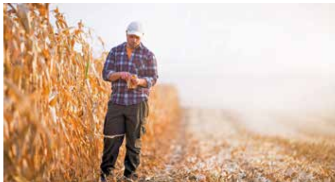
Wer beruflich viel im Freien tätig ist, hat ein stark erhöhtes Risiko für die Entstehung von hellem Hautkrebs.

wirtschaft oder der Baubranche, aber auch Gärtner, Mitarbeiter der Stadtreinigung, Hafenarbeiter sowie Profisportler und deren Trainerstab. Man denke hier etwa an Fußballer, Skisportler oder Radsportler. Sie alle sind durch ständige Sonnenexposition ganzjährig einem stark erhöhten Risiko ausgesetzt. Denn selbst im Winter dringen bis zu 90 Prozent der UVA- und UVB-Strahlen durch die Wolken und können zu Hautalterung, Hautkrebs und Augenschäden beitragen. In der warmen Jahreszeit ist die Gefahr noch höher. Um sich zu schützen, sollten daher gerade diese Menschen zur Prävention einige Punkte befolgen. Das beginnt mit einem