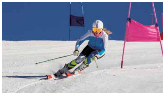
Profisportler wie Skifahrer sind oft besonders intensiv der UV-Strahlung ausgesetzt.

Kategorie 50+, schützt vor UVA- und UVB-Strahlen und ist gut verträglich. Der Sonnenschutz sollte täglich aufgetragen und zwischendurch erneuert werden. Auf der Kampagnen-Website www.action-gegen-hellen-hautkrebs.de gibt es weitere Informationen sowie einen Selbsttest