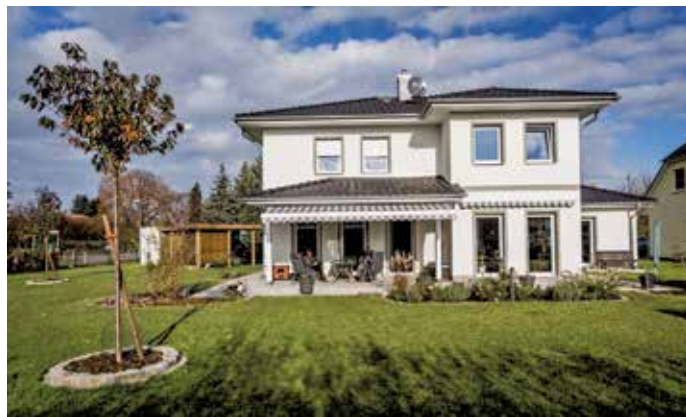
Steigende Anforderungen an die Energieeffizienz verteuern das Bauen. Verbraucherschützer fordern daher ein Bauklimageld, das Bauherren und Modernisierer motiviert, einen möglichst guten Energiestandard anzustreben.