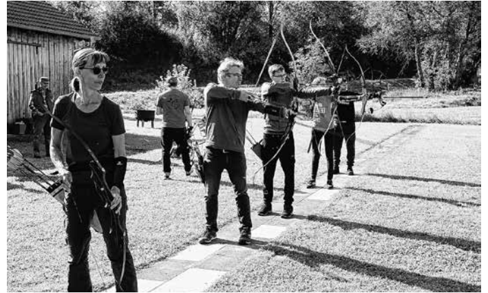
Bogenschützen an der Schießlinie

Nach der Siegerehrung war der „offizielle“ Teil zu Ende und der Tag konnte beim gemütlichen Beisammensein ausklingen.