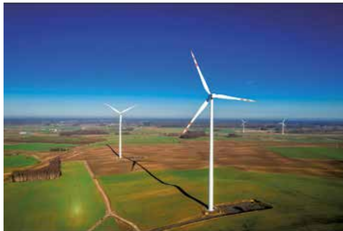
Energie aus Windkraftanlagen ist die wichtigste regenerative Energiequelle.

ger. Mehr Informationen gibt es auf www.verbraucherzentrale-energieberatung.de oder unter 0800 – 809 802 400 (kostenfrei). Die Energieberatung der Verbraucherzentrale wird gefördert vom Bundesministerium für Wirtschaft und Energie. (txn/sel)