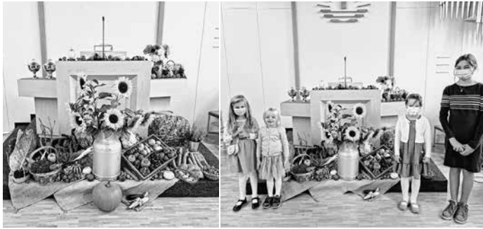
Erntedank 2021 – Hast du heute schon DANKE gesagt für so viel schöne Sachen?