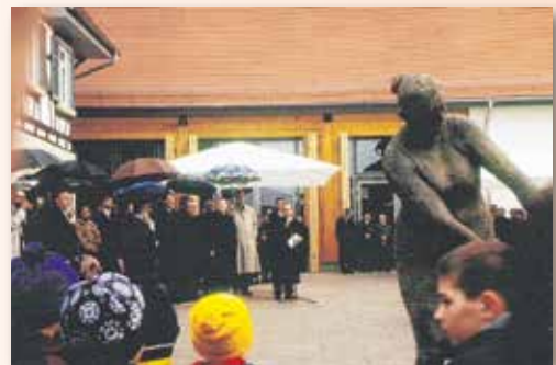
Feierlichkeiten am 24. Januar 2002