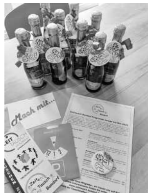
Jahresauftakt Januar 2022