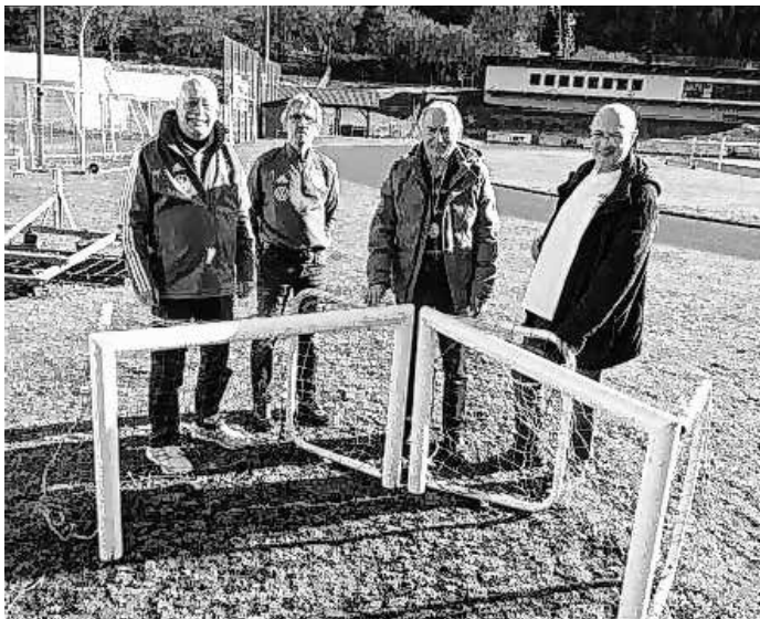
Übergabe der Minitore auf dem Sportplatz in Adenau.

Betroffene berichteten uns von der schlimmen Nacht vom 14. auf den 15. Juli. Innerhalb weniger Minuten waren die Wassermassen da und haben so gut wie alles mitgerissen und zerstört.