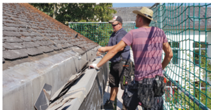
Verklammerung und Befestigung der Dachziegel bzw. -platten werden beim Dach-Check geprüft.

Sollten Schäden gefunden werden, wird der Kunde umfassend informiert und beraten. Unter www.dachcheck.dachdecker.org sind alle wichtigen Informationen für Hauseigentümer zusammengefasst. Auch Dachdeckerbetriebe können über diese Website gefunden werden. (akz-o/sel)