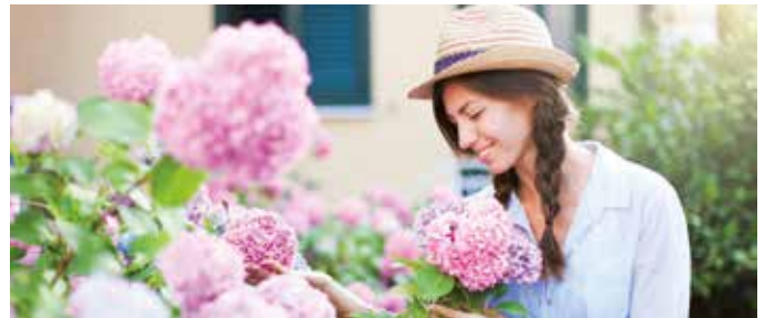
Mit ihrem wunderschönen Farbspektrum bereichern Hortensien auch schattige Gärten.

ausdrocknet, brauchen die Pflanzen immer wieder etwas Wasser. Deshalb bitte auch die bescheidenen Schattenpflanzen immer mal wieder mit der Gießkanne oder dem Wasserschlauch besuchen. (akz-o/sel)