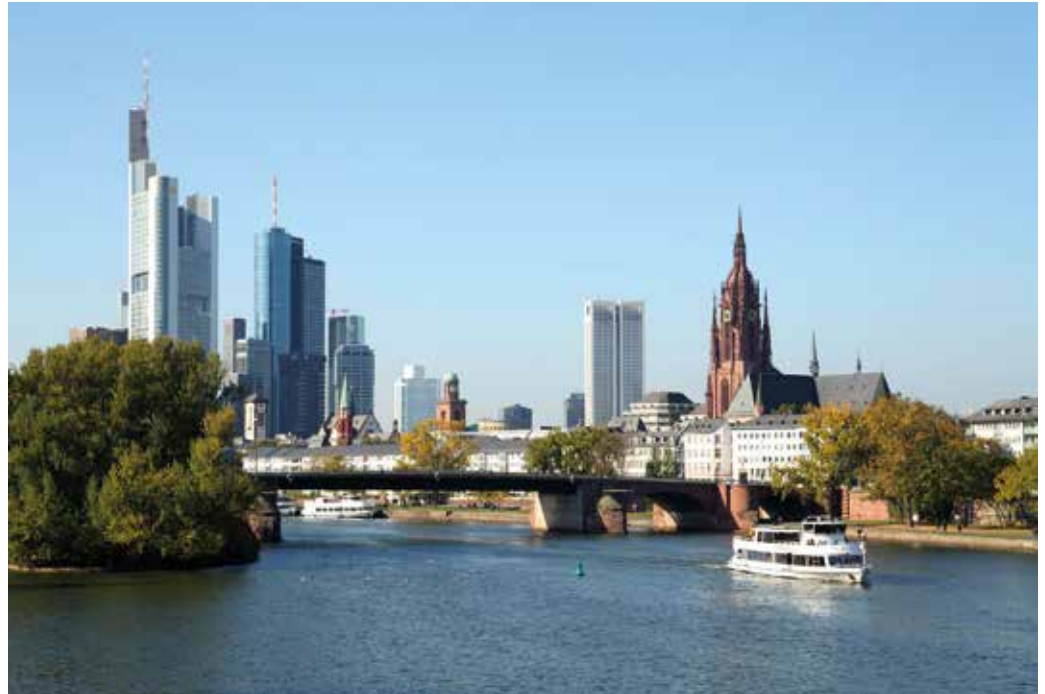
Als einzige Stadt Deutschlands präsentiert sich Frankfurt am Main mit einer einzigartigen Skyline aus Hochhäusern, die zugleich Wahrzeichen der Stadt sind. Mehr als 30 Gebäude sind über 100 Meter hoch, darunter 17 der 18 Wolkenkratzer Deutschlands.

Wer sich ganz bequem einen Überblick über die unterschiedlichen Seiten der Stadt verschaffen will, dem sei das 24-Stunden Hop-on-/ Hop-of-Busticket empfohlen. Einfach aussteigen, wo