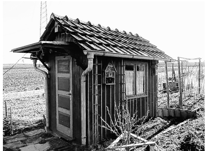
So sahen die ersten Gartenlauben aus

Weitere Information zum Verein und rund um den Garten gibt es auch auf der Homepage www.gartenfreunde-bondorf-gaeu.de