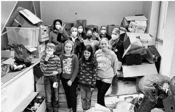
Ein Teil des Helferteams bei der Spendenannahme im Familienzentrum.