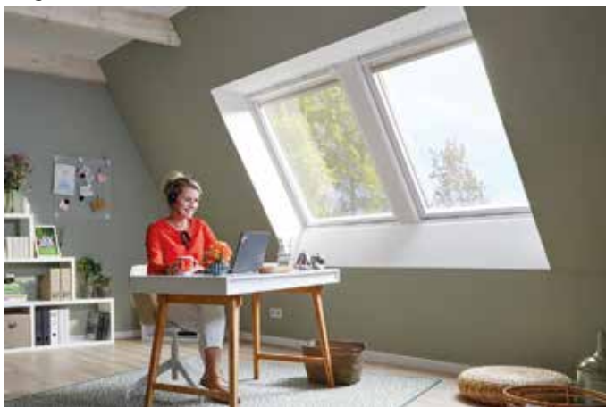
Das Dachgeschoss bietet mit viel Tageslicht optimale Voraussetzungen für ein Arbeitszimmer und schafft eine räumliche Trennung zwischen Arbeit und Privatleben.

Anspruch genommen werden, wenn der Ausbau des Dachgeschosses oder der Einbau neuer Fenster besonders energieeffizient realisiert werden soll. Dabei wird doppelt profitiert: Durch höhere Energieeffizienz und geringeren Wärmeverlust lassen sich Heizkosten sparen und ein Beitrag zum Klimaschutz leisten. (akz-o/sel)