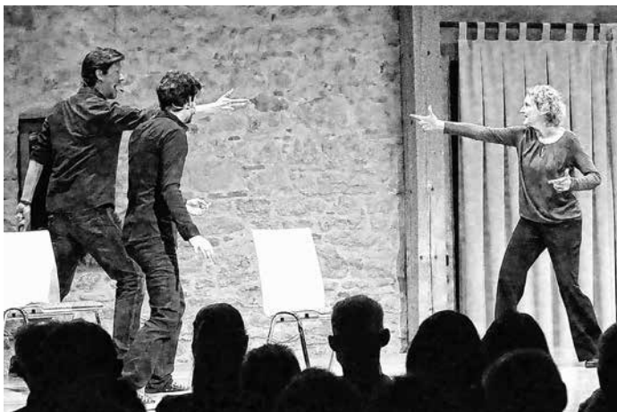
Thrillerszene zur Eroberung des Finanzamts