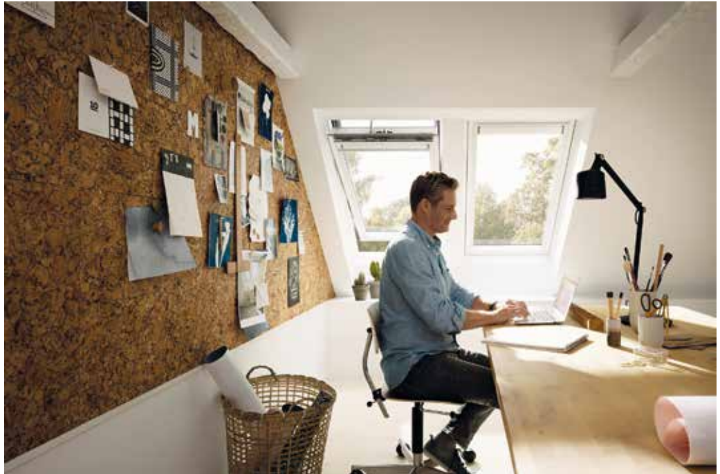
Wer die Möglichkeit hat, sollte die Chance, seinen Arbeitsplatz im Homeoffice attraktiv zu gestalten, nutzen.