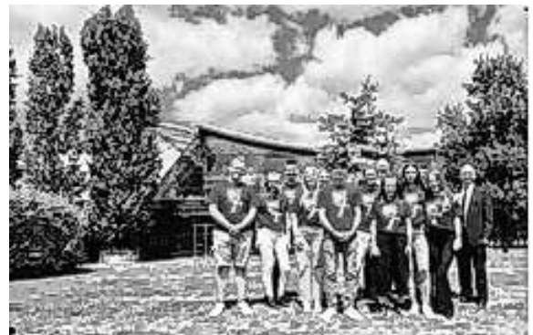
Jugendtag 10.7.2022 – In Gemeinschaft bleiben. 1. Johannesbrief 1 aus Vers 3

Weitere Infos unter www.nak-nagold.de/bondorf