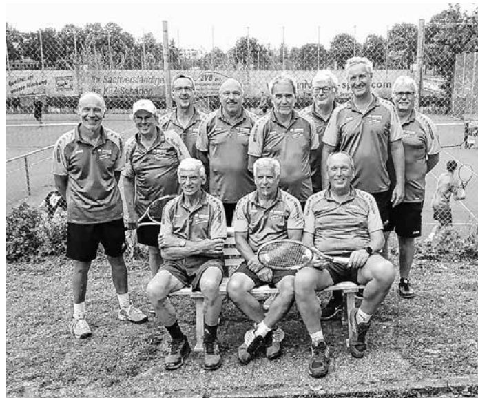
Die Männer der Herren 60

Am morgigen Samstag, 16. Juli 2022, geht es auf der Bondorfer Anlage gegen das Team aus Nordstetten.