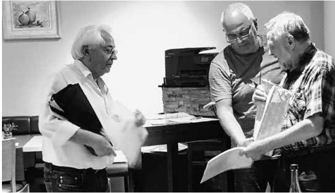
Ehrung 50 Jahre SV Bondorf sowie WSV und DSB