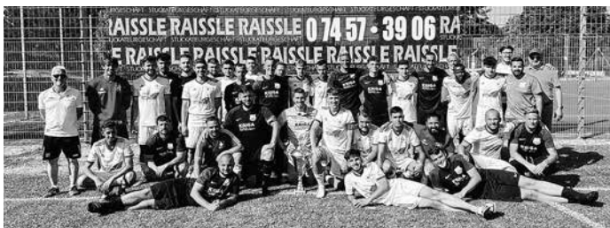
Die Finalmannschaften des FC Unterjettingen und Zrinski Calw.

Im Finale war Zrinski dann chancenlos und verlor gegen verdienten Turniersieger aus Unterjettingen deutlich mit 6:0 Toren.