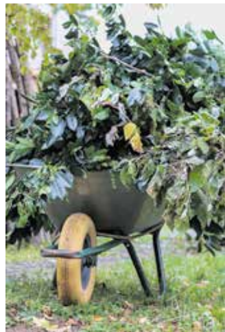
Aus Schnittgut wird wertvoller Kompost.

Außenbeleuchtung sollte möglichst nach unten gerichtet sein und mit LED in warmweißen Farben betrieben werden.