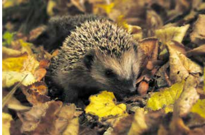
Im naturnahen Garten finden Igel unter Blätterhaufen ein feines Plätzchen als Winterquartier.

Im Herbst und Winter nutzen viele Menschen die Zeit, sich Gedanken über die Neu- oder Umgestaltung ihres Gartens zu machen. Damit zum nächsten Frühjahr und Sommer der Garten für die menschlichen und tierischen Nutzer zum wertvollen Lebensraum wird, rät der Verband Privater Bauherren, sich über die abnehmende Zahl von Tieren und Pflanzen auf unserem Globus Gedanken zu machen. „Die Natur ist vielfach durch den Menschen bedroht. Umso mehr ist es wichtig, dass jeder versucht, einen Beitrag für den Erhalt der Artenvielfalt zu leisten. Hauseigentümer können in ihre Hausgärten viel für Pflanzen- und Tierwelt tun“, heißt es in einer Pressemitteilung. Die Erfahrung zeige, dass die Natur erstaunlich widerstandsfähig ist. Wenn für die richtigen Bedingungen gesorgt ist, profitieren Pflanzen und Tiere vom Hausgarten.