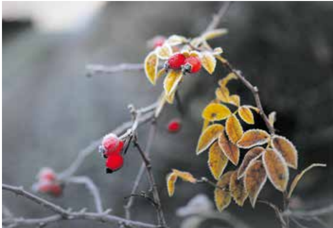
Im Winter ein Hingucker sind heimische Hagebutten

IMMOBILIEN SERVICE BÄRDEL BÄHR Tel.: 07031 4918-500 | baerbel-bahr.de