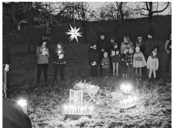
Jugend- u. Familienweihnacht auf der Wiese

An Heiligabend um 16.00 Uhr feiern wir mit Kindern und Familien unsere Krippenfeier in Jettingen. Wir freuen uns auf euch!