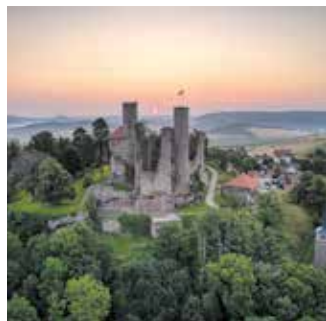
Blick auf Burg Hanstein bei Sonnenaufgang: Sie gilt als eine der größten Burgruinen Mitteldeutschlands.