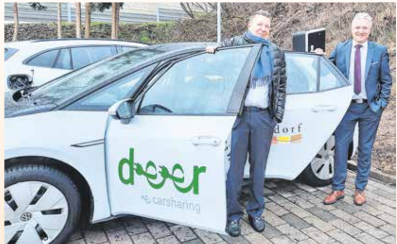
Fa. deer/R.Zahorka, BM B.Dürr