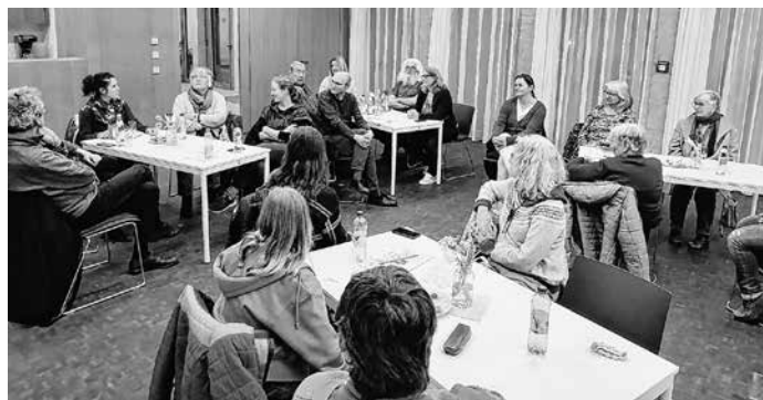
Treffen am 13. Februar 2023

Alle wichtigen Informationen zum ZeitTausch Bondorf finden Sie auf unserer Homepage unter www.zeittausch.bondorf.de