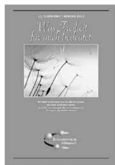
Das Leseheft aus dem Jahr 2022