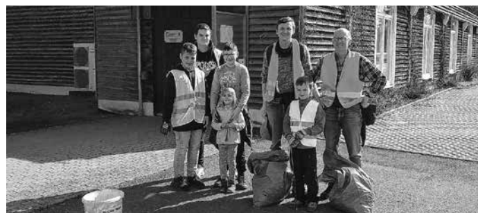
Unsere Teilnehmer vor der Schießanlage

nachbarn. Hierfür danken wir der Gemeinde und dem Familienzentrum Bondorf e. V. Insgesamt war es eine gute Veranstaltung und unsere Umgebung ist wieder ein Stück wohnlicher geworden.