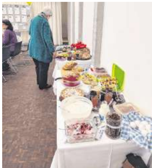
Treffen am 13. Mai 2023