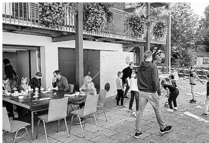
Hier war was los...!