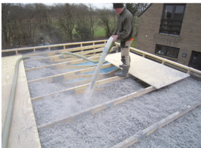
Die hohe Luftdichtheit ist auch die Basis für den hervorragenden Kälte- und Hitzeschutz von Cellulose. Im Winter bleibt es wohlig warm, im Sommer wird die Hitze ausgesperrt.