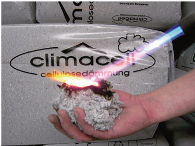
Die luftdichte Anordnung der Cellulosefasern verhindert die Sauerstoffzufuhr. Das Feuer erhält weniger Nahrung und brennt nicht weiter.

Die hohe Luftdichtheit bildet übrigens auch die Basis für den hervorragenden Kälte- und Hitzeschutz, den das ökologische Dämmmaterial bietet. Während es im Winter wohlig warm im Haus bleibt, wird die sommerliche Hitze zuverlässig ausgesperrt. (pr-jaeger/sel)