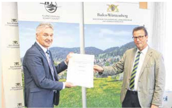
BM Bernd Dürr und Minister Peter Hauk, MdB