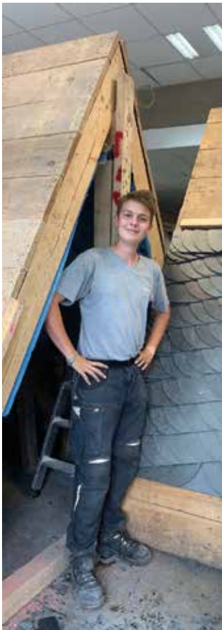
Am Boden gelernt, auf dem Dach angewendet. So gelingt die Ausbildung zum Dachdecker.

mer und iPad. Infos zum Beruf und Hilfe bei der Suche nach einem passenden Ausbildungsbetrieb gibt es hier: www.dachdeckerdeinberuf.de (akz-o/sel)