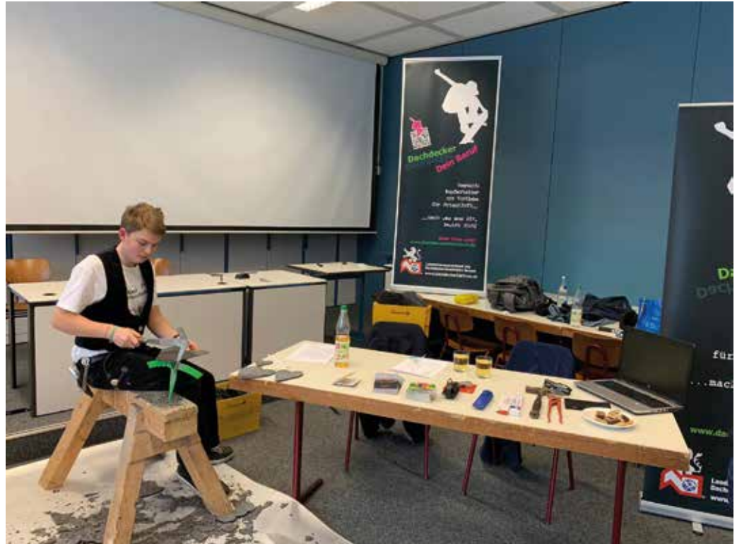
Laptop und Schieferhammer, zwei wichtige Begleiter in der Dachdeckerausbildung.