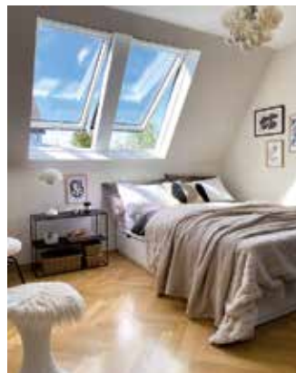
Viel Licht durch Dachfenster erhöht die Attraktivität eines Gästezimmers unter dem Dach deutlich.

Zudem ist der bauliche Aufwand deutlich geringer“, empfiehlt Christina Brunner, Tageslichtexpertin von Velux. Schon mit einem Dachfenster kann der Dachboden zu einem lichtdurchfluteten Raum werden, der durch viel Tageslicht zum Verweilen einlädt. Auch die Kombination von mehreren Fenstern neben- oder übereinander ist möglich und wertet den Bereich zusätzlich auf. Neben Bett und Schrank gewinnt in vielen Gästezimmern die Einrichtung eines Arbeitsplatzes zunehmend an Bedeutung. Die wachsende Akzeptanz von Homeoffice und Online-Veranstaltungen an Universitäten eröffnet neue Möglichkeiten, den Besuch von Verwandten und Freunden über das Wochenende hinaus auszudehnen.