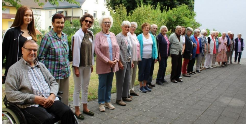
Seniorenfreizeit 2019

von Montag, 2. August bis Freitag, 6. August 2021